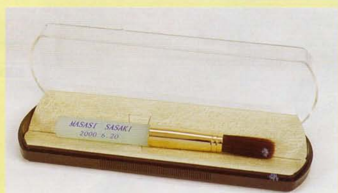
パステルカラー軸 (ライトブルー)