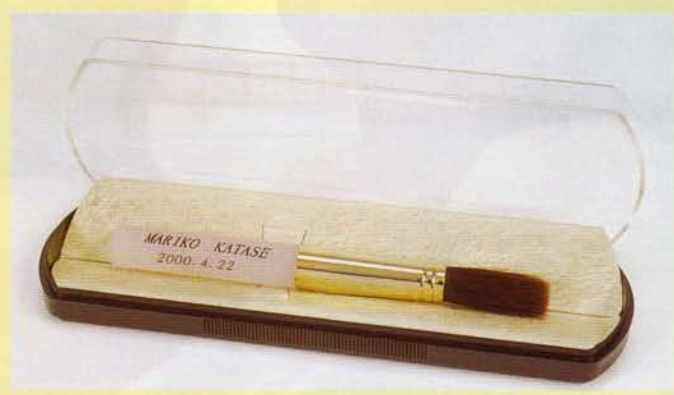
パステルカラー軸 (ピンク)