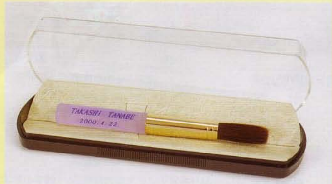
パステルカラー軸 (パープル)