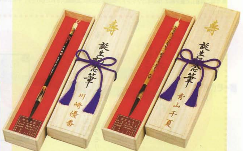
あけぼの塗オランダ水牛ダルマ軸