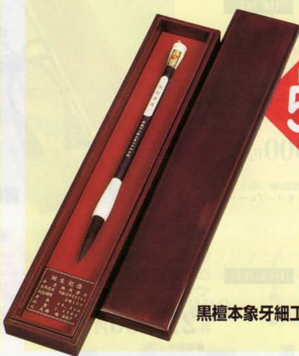
黒檀本象牙細工軸