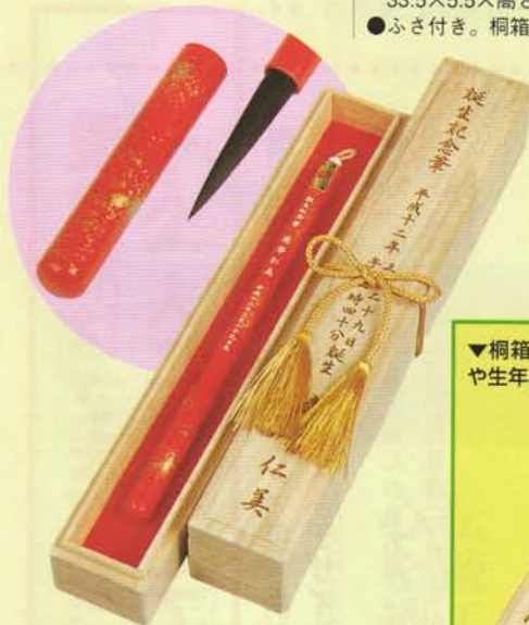
朱塗金銀共さや軸