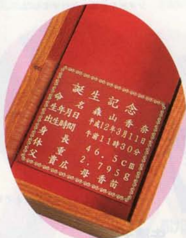
写真④ プレートサイズ縦5×横5.3cm